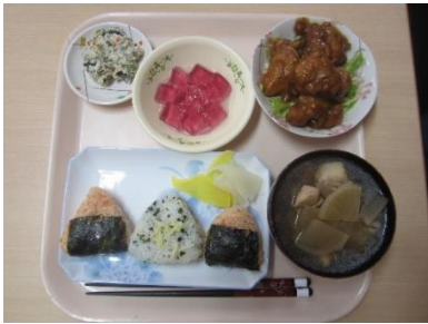
美味しい芋煮汁と職員お手製のおむすびです。生姜がいい香りでした♪