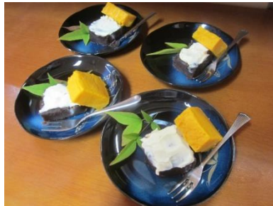
午後のデザートはさつまいもとあんこのクリームチーズ添えです♪